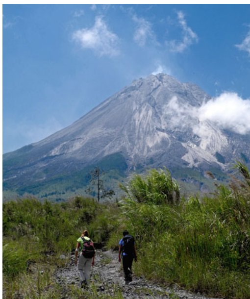
Le volcan Mérapi vu du sud-ouest en 2013.