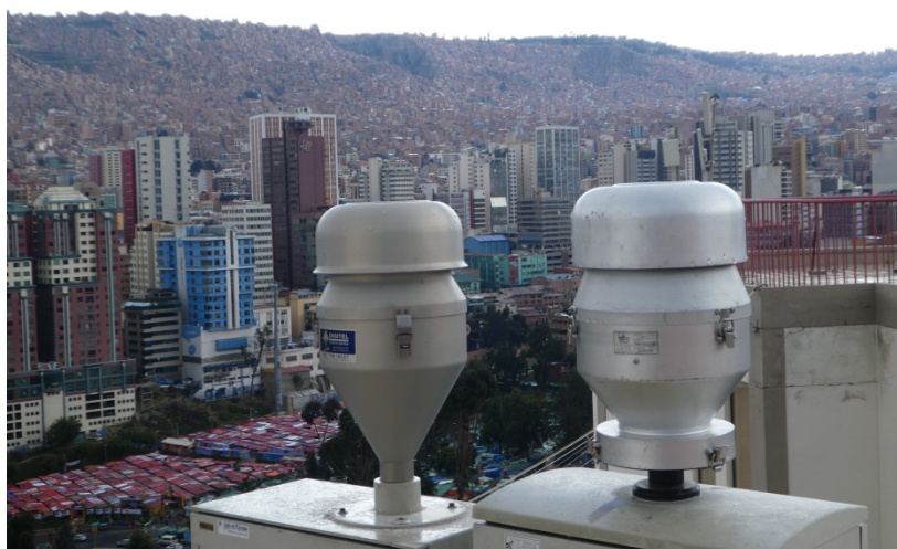
Fig 2 : Prélèvement d'aérosols à la station Pipiripi, La Paz, Bolivie , Janv 2018.